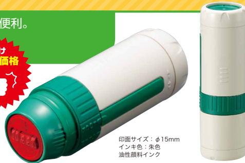
印面サイズ: φ15mm インキ色: 朱色 油性顔料インク